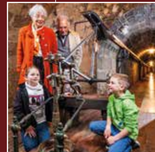
Karl-Theodor-Pumpe The Karl Theodor pump