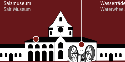
Salzmuseum Salt Museum